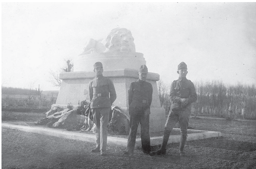
Аустроугарски војници на Војничком гробљу у Шумарицама, после постављања споменика лава у средишту гробља 1916. године

Другим речима, од тог тренутка, па до ослобођења Крагујевца 1918, сви аустроугарски војници који би преминули у Крагујевцу сахрањивани су у Шумарицама. За њих је 1917. године направљена посебна парцела на гробљу, а нешто раније (1916) уређен је значајан део гробља настао током првих година Великог рата. Осим тога, адаптирана је централна парцела с циљем постављања споменика, који је као ратни плен пребачен из Венчачког рудника у Шумарице током лета 1916. Реч је о монументалном споменику лава од мермера, израђеног у природној величини, а првобитно намењеном за маузолеј Карађорђевића на Опленцу. За овај споменик аустроугарске власти су припремиле високо озидано постоље, на коме су уgravирали латинске речи Pro Patria (За домовину), које су после рата измењене у Захвална ошацибина 1914–1918 . 16 За разлику од њих, немачки окупатори, који су