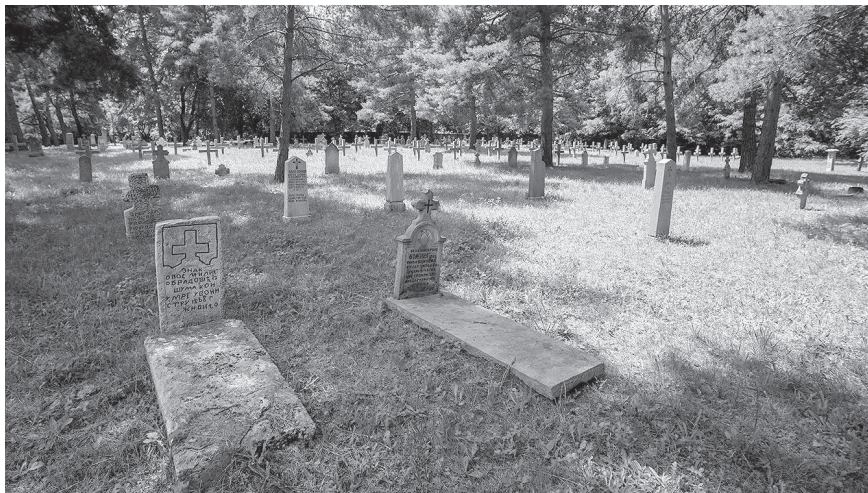
Старо војничко гробље у крагујевачким Шумарицама данас

Данас Старо војничко гробље у крагујевачким Шумарицама представља меморијални простор немерљиве историјске и етнолошке вредности. У питању је најстарије војничко гробље сталног карактера у Србији (постоји од 1866), али и највеће са око 5.000 сахрањених лица – завршна процена упућује на приближно 3.500 српских и југословенских војника, око 1.000 аустроугарских, 361 немачког и шесторицу руских и совјетских војника. Сачувани надгробни споменици на њему истовремено представљају праву скулпторску галерију разноврсних дела сепулкралног градитељства, преко које на једном месту пратимо развој богате народне уметности од средине XIX до средине XX века, као и сећање на нововековну српску историју и на наше претке војнике. Ради се о културном добру од изузетног значаја, не само као делу ширег спомен-комплекса у Шумарицама, већ и као засебне целине. Упркос томе, историја и значај овог локалитета су недовољно познати широј јавности, са мноштвом лажних или полуправдинитих ревизионистичких прича, идеолошки обојених, па самим тим гробље не чини део наших колективних идентитета онако како то, усуђујемо се да кажемо, заслужује да буде. Зато је неопходно у потпуности га ревитализовати, како у материјалном, тако и у културном смислу речи. Прецизније, потребно је сачувати гробље у складу са савременим принципима конзерваторске заштите, а уједно упознати